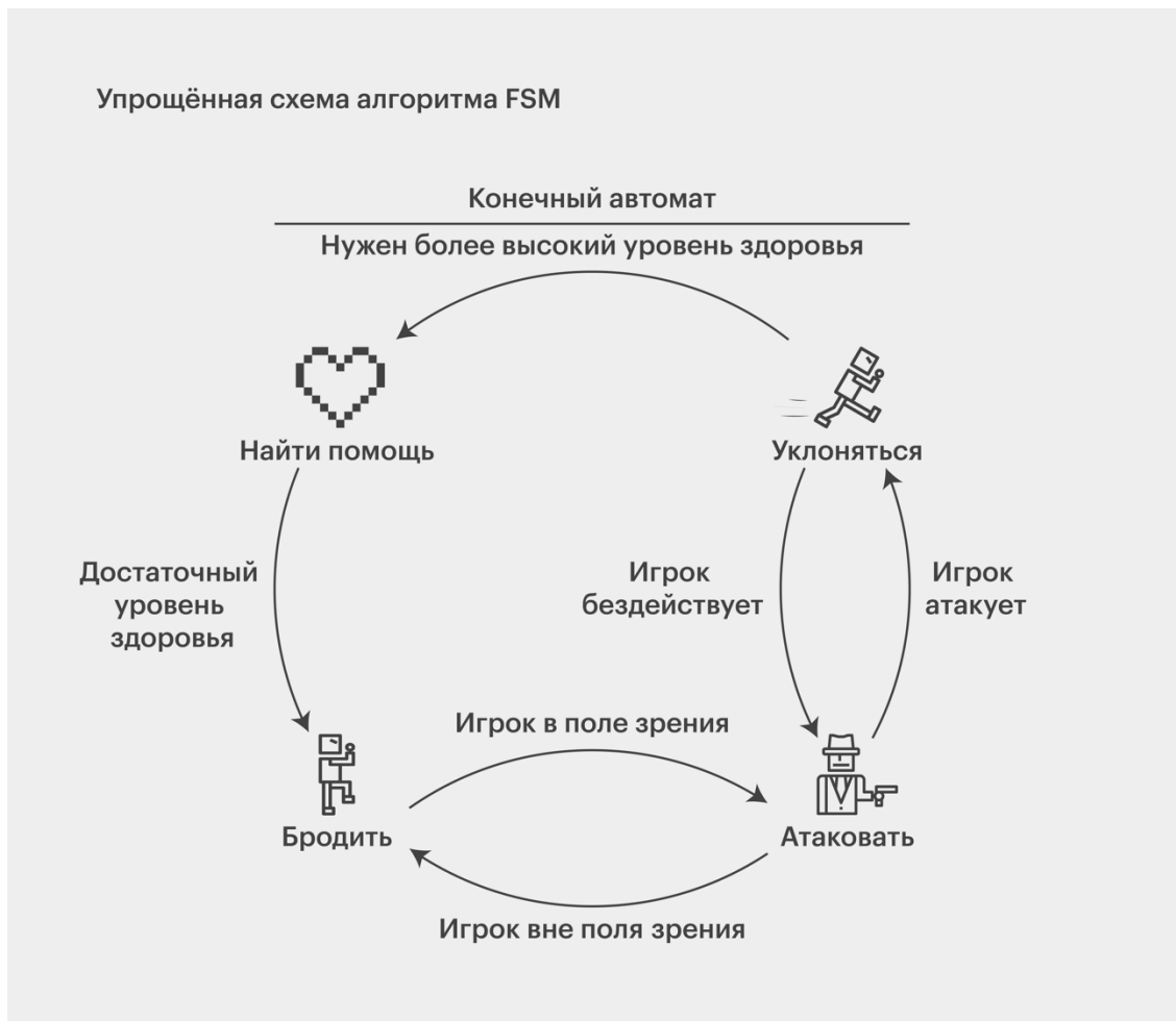
Рисунок №3. Упрощенная схема алгоритма FSM, применяющегося в модулях управления сценариями компьютерных игр

Важно отметить, что игровой сценарий представляет собой ключевой технический продукт с полной картиной компьютерной игры и дополнительными инструкциями. Без акцента на историю нельзя донести замысел разработчиков, создать связь между всеми компонентами. Поэтому важно понимать, насколько неразрывна связь между модулем управления сценарием и готовым геймплеем видеоигры. А алгоритмы искусственного интеллекта в первую очередь работают над совершенствованием технической составляющей, то есть игровых механик и геймплея – и именно за счет этого формируется баланс творческого и программного, достигается эффект полного погружения (ценный сейчас иммерсивный подход) [6], [7], [8]. Однако технологии ИИ обладают и некоторыми недостатками, например,