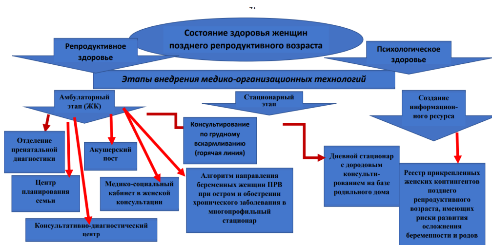
Рисунок 1. - Медико-организационные технологии сохранения здоровья женщин позднего репродуктивного возраста в условиях присоединения женских консультаций к многопрофильным стационарам

Автор рассматривает этапы внедрения медико-организационных технологий во взаимосвязи как с репродуктивным, так и с психологическим здоровьем женщины (Рис.1.).