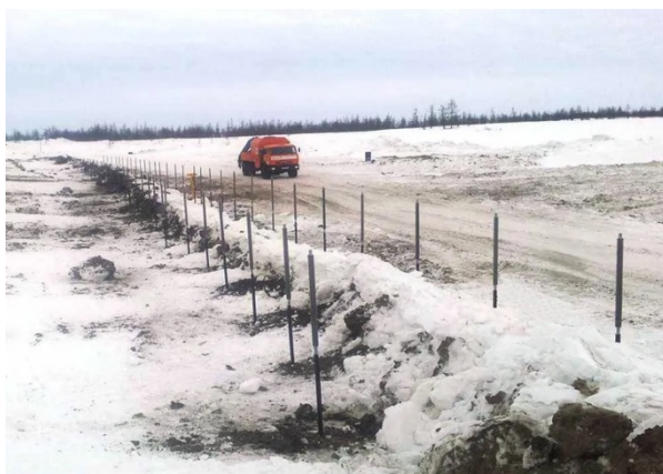
Рисунок 4 — Термостабилизаторы

Термоскважины — это специальные системы, которые используются для контроля температуры в многолетнемерзлых грунтах. Они могут представлять собой забуренные скважины, которые наполнены средой, способствующей передаче тепла, либо использовать системы с циркуляцией холодной или горячей жидкости.