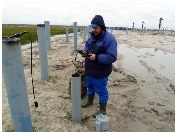
Рисунок 5 — Термоскважины

Термоскважины — это специальные системы, которые используются для контроля температуры в многолетнемерзлых грунтах. Они могут представлять собой забуренные скважины, которые наполнены средой, способствующей передаче тепла, либо использовать системы с циркуляцией холодной или горячей жидкости.