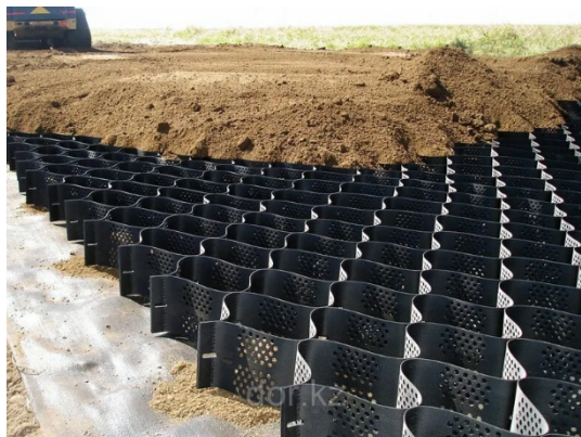
Рисунок 2 — георешётка

Георешётка благодаря своей ячеистой структуре надёжно удерживает наполнитель: песок, гравий, грунт, бетонные смеси. Это не позволяет ему рассыпаться или растечься — формируется фиксированная конструкция. Сочетание полимерных объёмных «сот» с наполнителем создаёт упругую «подушку», которая помогает распределить нагрузку на дорожное полотно равномерно. В результате снижается риск образования провалов, появления колеи и других дефектов.