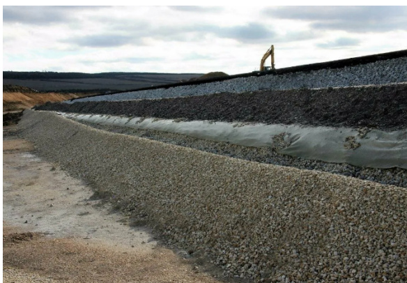
Рисунок 3 — Укладывание рыхлых песчаных или гравийных слоёв под дорожное полотно

Проектирование и устройство дренирующего слоя зависит от природных условий местности, профиля земляного полотна и конструкции дорожной одежды.