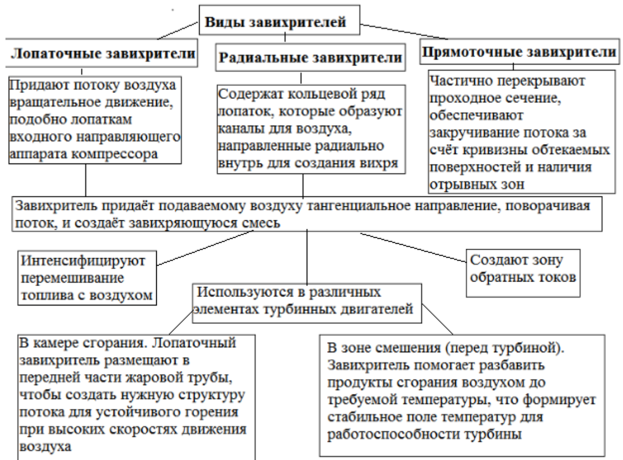
Рис.2 Работа завихрителей в зависимости от вида и функций

горения. При этом, важно понимать, что многое зависит от вида завихрителя и его применения (рис.2).