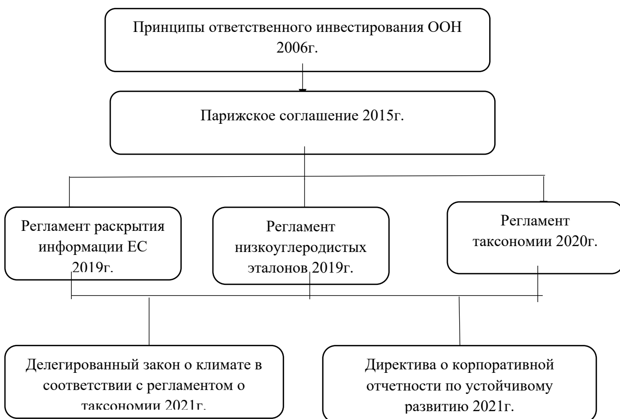
Рисунок 1 - Система нормативно-правового регулирования концепции устойчивого развития в Европейском Союзе [Разработано автором]

Система нормативно-правового регулирования концепции устойчивого развития в Европейском Союзе представлена на рисунке 1.