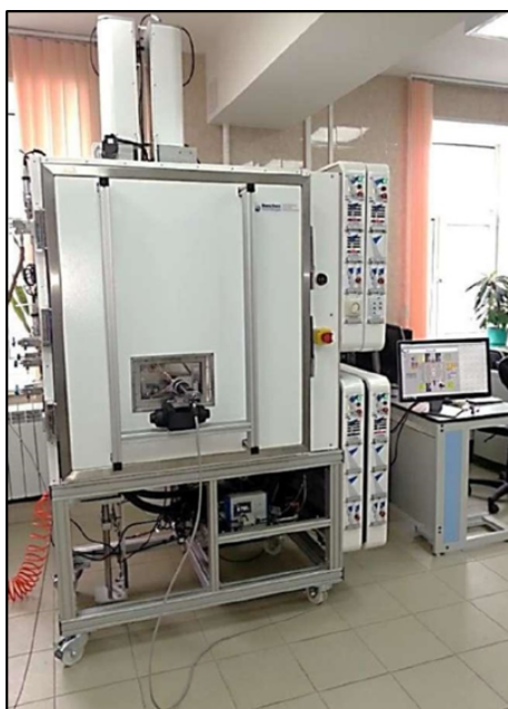
Рисунок 1. Лабораторная установка AWAI-1000 производства фирмы Sanchez Technologies

Для анализ выпадения парафиновых веществ из пластовых нефтей при различных давлениях и изменении температуры визуальным и спектроскопическим методами исследований по объектам, проводимого в Инновационно-технологическом центре арктических нефтегазовых исследований на базе САФУ имени М.В. Ломоносова будет использоваться установка AWAI-1000 производства фирмы Sanchez Technologies. Фото установки представлено на рисунке 1.