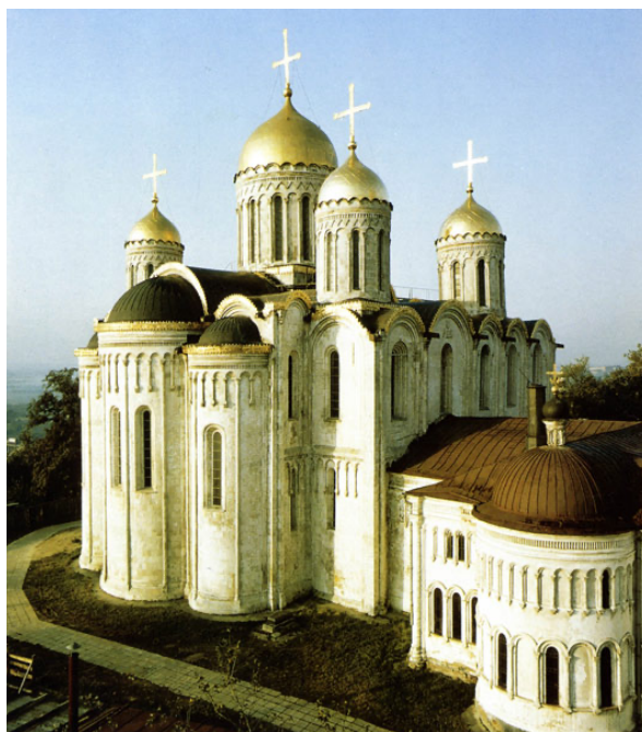
Рис.2 Успенский собор во Владимире.

Одним из примеров такой постройки является Успенский собор во Владимире (1158–1160 гг.), который строился из белого камня с использованием арочных конструкций и декоративных элементов. Для этого привлекались иностранные мастера (из Византии и Европы), что способствовало уже первым заимствованиям новых зарубежных технологий кладки и сводчатых перекрытий.