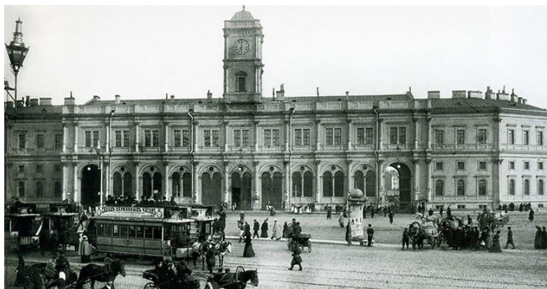
Рис.3 Николаевский вокзал в Санкт-Петербурге.

иллюстрируют адаптацию исторических традиций к требованиям индустриальной эпохи.