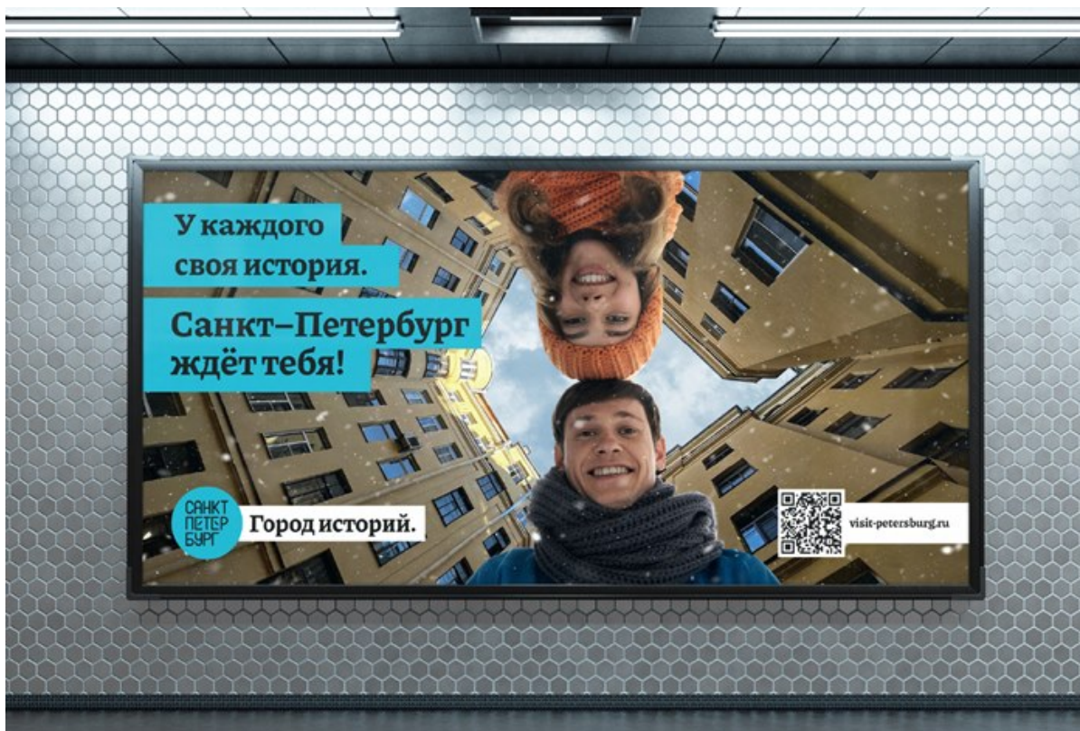
Рис. 4 «Санкт-Петербург: Город историй»

Таким образом, у создателей получилось привлечь внимание туристов к мероприятиям на все сезоны года и увеличить процент туристов из других регионов страны.