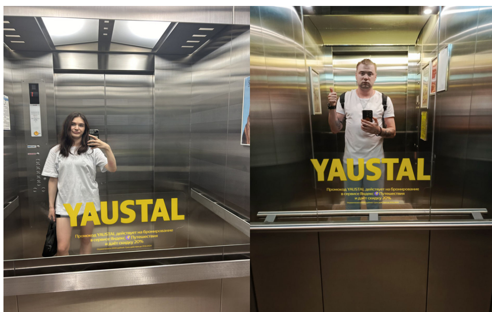
Рис. 2 и 3 «Яндекс Путешествия: YAUSTAL»

Рекламная кампания «Санкт-Петербург: город историй» привлекла свое внимание весной 2024. Главной целью кампании является наращивание турпотока в город и развитие внутреннего туризма. Также это способ борьбы с «низким сезоном», т.к. основной поток туристов приезжает в город только весной и лето, но Санкт-Петербург предлагает места для посещения и в другие времена года: роскошные дворцы и музеи, гастрономические мероприятия, природные заповедники и парки, огромное количество общественно-культурных пространств [5].