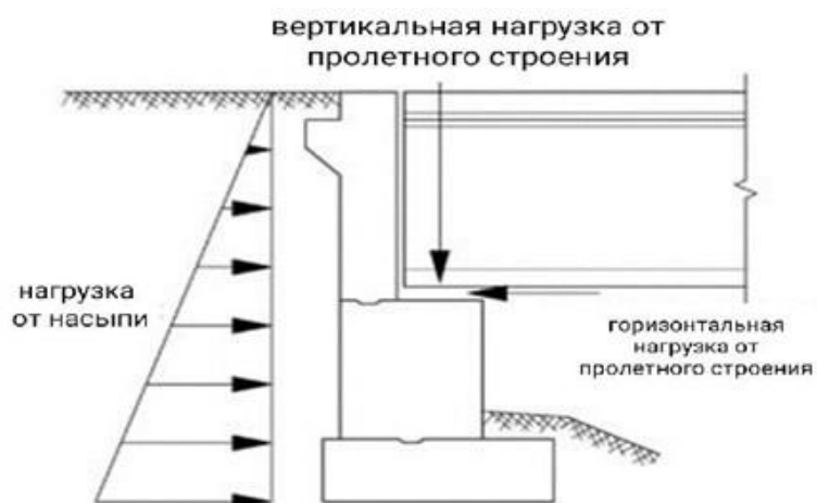
Рис. 3 Воздействие нагрузок на опору через опорные части

Свайные опоры применяются при пересечениях железной и автодорог, суходолов и небольших рек [11-12]. Воздействие нагрузок на опору через опорные части показано на рисунке 3.