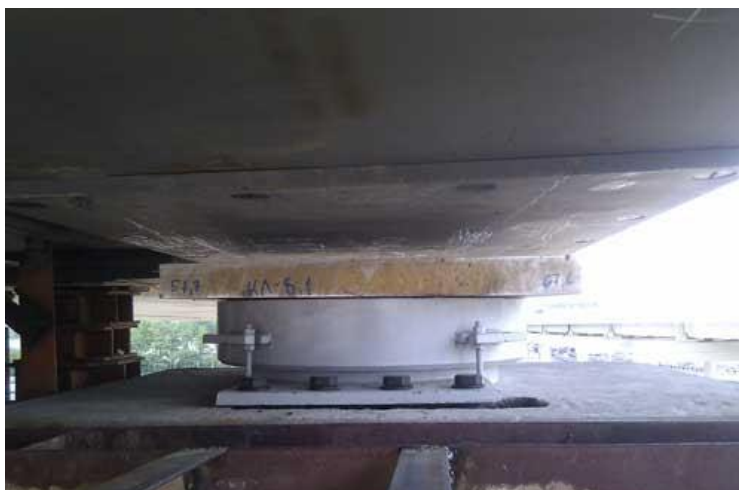
Рис. 1 Установленная опорная часть моста

В транспортной области мосты представляют значимую роль для объектов транспорта и людей. Элементами пролетного строения являются опорные части мостов, передающие на фундамент нагрузку от пролетов (рис. 1).