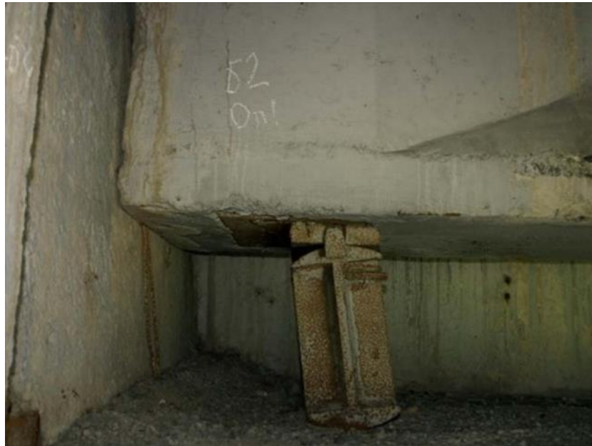
Рис. 5 Дефекты опорных частей: а) расслоение опорной части б) коррозия опорной части

Также учитывают и изменения климата. Из-за увеличения дождей, снежных бурь и сильных ураганных ветров проектировщики должны более тщательно производить расчеты мостовых опор. Благодаря постоянному наблюдению за состоянием мостовых опор и изменениям в нагрузках обеспечивается безопасность мостов. Основные дефекты опорных частей приведены на рисунке 5.