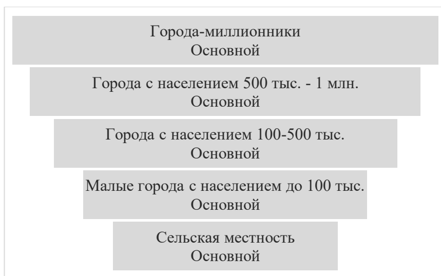
Рисунок 2 – Рисунок - Распределение трудоустройства выпускников России по населенным пунктам работают по специальности за 2023 г., % 2

Анализируя представленную статистику на рис.2, мы видим значительную разницу в показателях трудоустройства молодых специалистов в зависимости от типа населенного пункта. Так, можно отметить преимущество городов-миллионников (36%). Средние города демонстрируют относительно высокий уровень трудоустройства по специальности (33%). А вот в маленьких городах и селах меньшая вероятность найти работу по полученной профессии. Например, в малых городах (менее 100 тысяч жителей) лишь 24% находят подходящую специальность, а в сельской местности эта цифра падает до 19%. Здесь играет роль ограниченность рынка труда и отсутствие спроса на узкопрофильные специалисты.