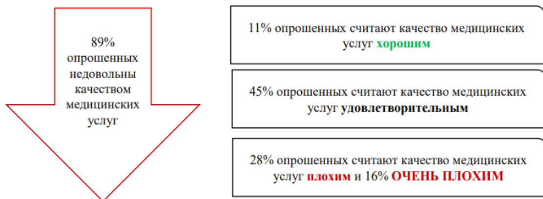
Рисунок 4. Данные соцопроса холдинга «Ромир» о качестве медицинских услуг [8]

Применительно к ранее действовавшим методикам оценки подобные ответы опрошенных могли лечь в основу двух разных показателей и каждый из них был бы низким. Однако в совокупном показателе удовлетворенности граждан услугами в сферах образования, здравоохранения, культуры, социального обслуживания данные низкие показатели могут быть смягчены процентами, полученными по итогам опросов о качестве услуг в сфере культуры и социального обслуживания.