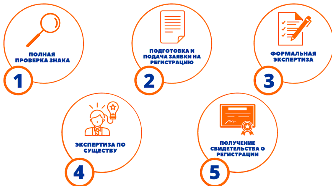
Рисунок 6 — Процесс регистрации товарного знака в России: основные этапы и требования