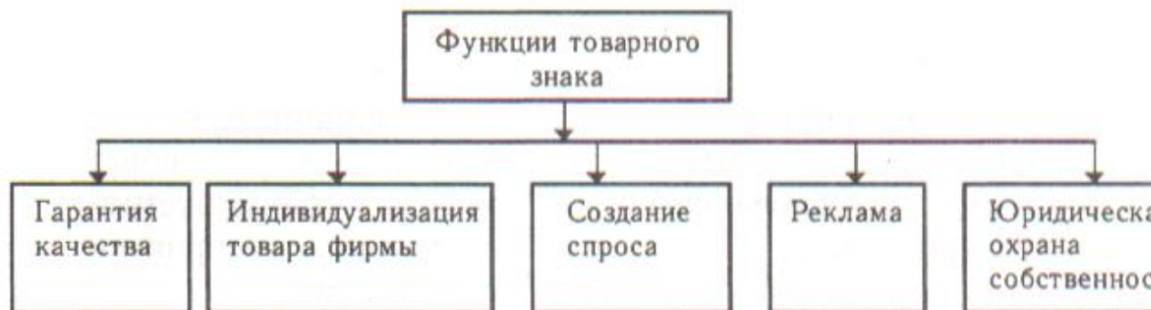
Рисунок 3 — Функции товарного знака и его роль в идентификации продукции и маркетинге