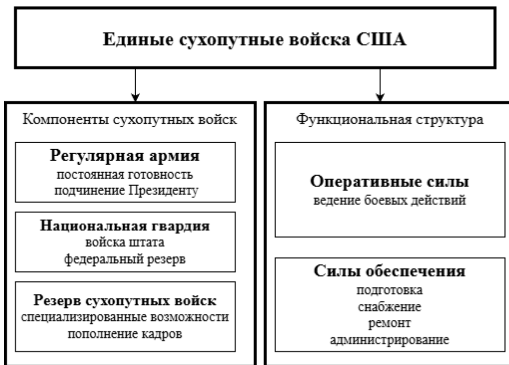
Рисунок 1. Устройство сухопутных войск США: компоненты функциональная структура

Стратегические задачи и ключевые компетенции. Оперативное предназначение Сухопутных войск раскрывается через три взаимосвязанных элемента: условия применения, стратегические задачи и ключевые компетенции.