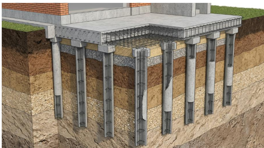
Рис.1 – Свайно-плитный фундамент в разрезе

Современное гражданское строительство в Краснодарском крае не славится площадками с благоприятными инженерно-геологическими условиями. Немалое количество жилых домов возводится на территориях близь русла реки Кубань, где большее количество оснований с мощными толщами слабых водонасыщенных грунтов.